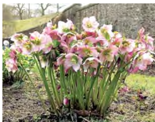
МОРОЗНИК ВОСТОЧНЫЙ (40–50 лет)

Высота 30–40 см, солнце, полутень. Прострел относится к числу немногих весенних цветов, которые благодаря листве и плодам красивы до осени.