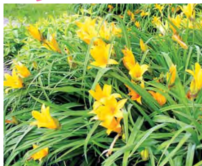
ЛИЛЕЙНИК ГИБРИДНЫЙ (15 лет)

Растение 30–40 см высотой для солнечных и частично затененных цветников. Настоящий шик — иметь в саду большую группу морозников разных сортов. Рассада стоит очень дорого, но раннее цветение этого необычного растения того стоит.