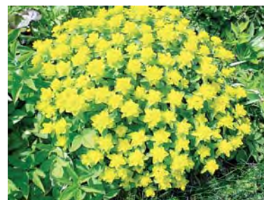
МОЛОЧАЙ МНОГОЦВЕТНЫЙ (15 лет)

Для этого невысокого (10–15 см) растения подходят тень и полутень. Сорта печеночниц неимоверно дороги, а вот природный вид с простыми сиреневыми цветками доступен. Его можно размножить семенами и использовать как почвопокровное растение.