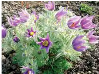
ПРОСТРЕЛ ОБЫКНОВЕННЫЙ (20 лет)

Хорошо выбирайте и готовьте место для долгоживущих многолетников. Старайтесь учесть все, что пишут о том или ином растении в справочниках. Если спустя несколько лет вы не столкнетесь с ошибками, допущенными при посадке, больших хлопот уже не будет. Учитывайте конечные размеры растений, не размещайте их слишком тесно. Лучше потерпеть пару сезонов, пока они разрастутся, чем потом выкапывать и рассаживать большие тяжелые кусты.