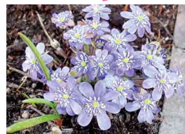
ПЕЧЕНОЧНИЦА ОБЫКНОВЕННАЯ (20 лет)

Растение для тенистых и полутенистых мест, высота 30–40 см. Цветущие заросли триллиумов в тенистом саду смотрятся просто сказочно. Листва не теряет декоративности до осени. Триллиум крупноцветковый популярен благодаря наличию эффектных сортов, но красивы и долговечны и другие представители рода.