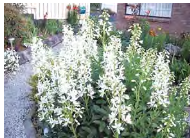
ЯСЕНЕЦ БЕЛЫЙ (20 лет)

Высота 40–50 см. Очень стойкое и неприхотливое растение для солнечных мест. Классикой считается его посадка перед декоративными луками. Молочай подчеркивает красоту соцветий луков, а затем прикрывает их желтеющую листву.