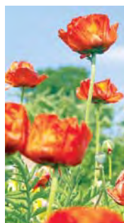
МАК ВОСТОЧНЫЙ (10 лет)

Предпочитает солнечное местоположение, большинство сортов — 70–80 см высотой. После цветения надземная часть мака восточного отмирает до следующего года. Выбирайте место так, чтобы во второй половине лета пустое место в цветнике было закрыто соседними растениями.