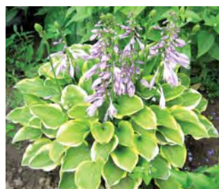
ХОСТА ГИБРИДНАЯ (10–15 лет)

Идеальное растение для тенистых и полутеневых цветников. Есть сорта хост, которые отлично чувствуют себя и на солнце. Высота до 120 см. Будьте внимательны: растения разных сортов сильно отличаются размерами. Не теряйте этикетки с названиями сортов, отведите каждому место в соответствии с шириной куста.